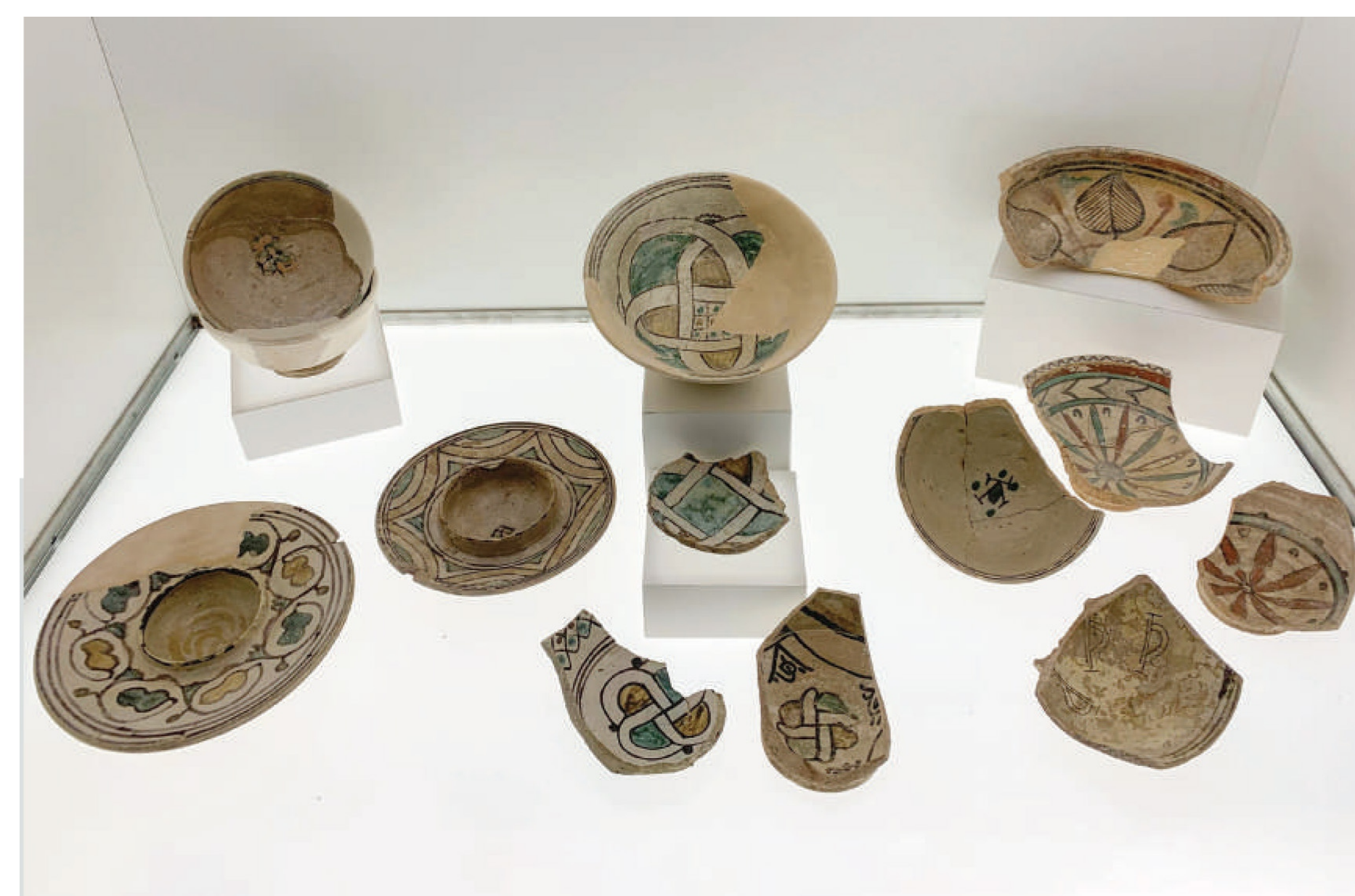
Fig. 1. Melfi. Museo Archeologico Nazionale Massimo Pallottino. Salsiere, coppe e bacini della seconda metà del XIII secolo.