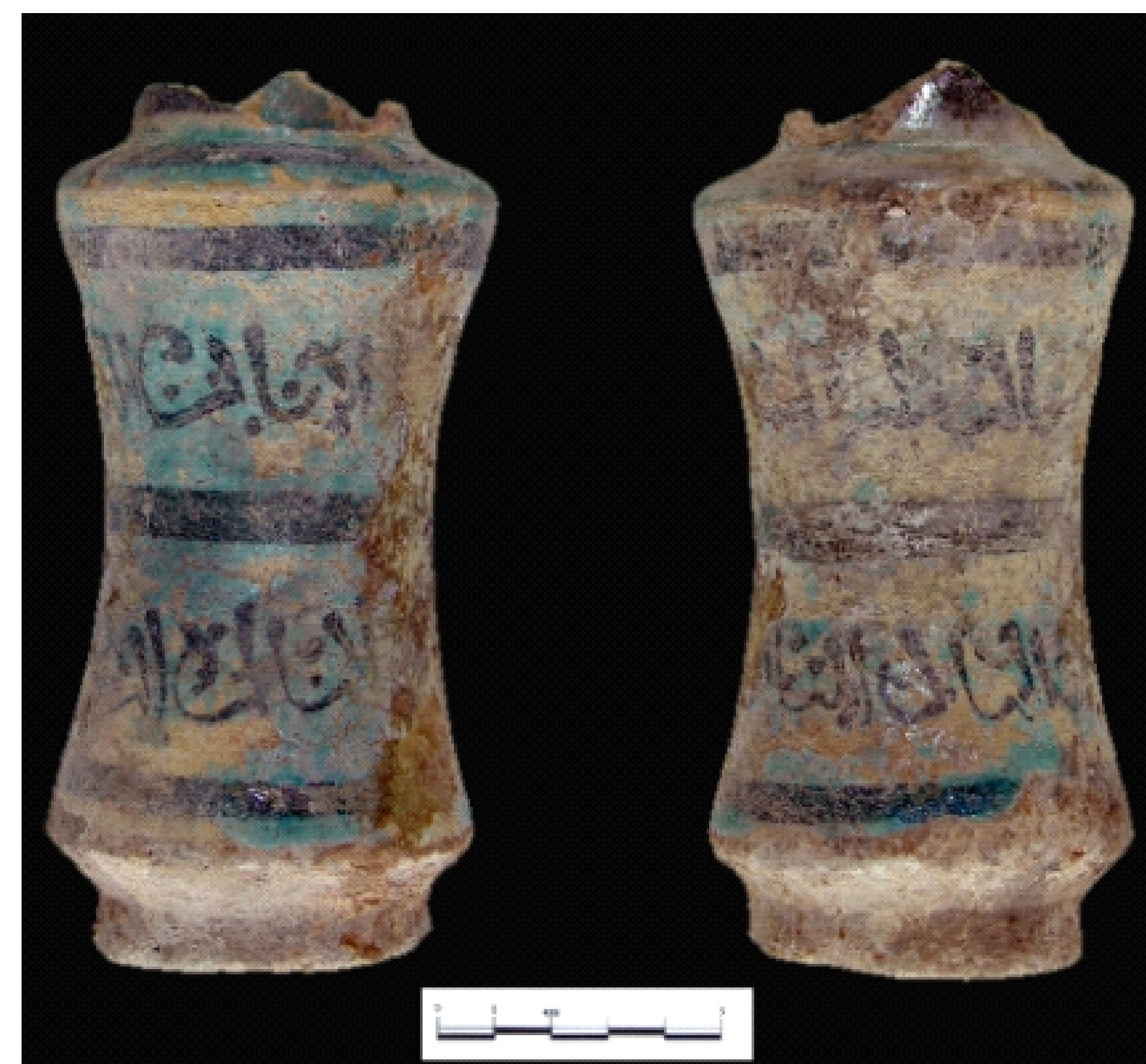
Fig. 3. Ravello. Villa Rufolo. Albarello di importazione egiziana con iscrizione beneaugurale in caratteri cufici (XIII secolo) (Sede della Soprintendenza Archeologica di Salerno)