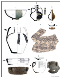
Fig. 2. Selección del material cerámico (ss. XII-XIII) de la Torre de Haches.

Esta relevancia ha quedado patente en los resultados arqueológicos donde se puso en evidencia tanto la gran torre de tapial hormigonado conservada, como todo un recinto murado perimetral (0,2 ha) con diferentes torres (Fig. 1). La cronología de la cerámica recuperada en los estratos de abandono (Fig. 2), indica el fin de la ocupación andalusí a inicios del s. XIII probablemente con la conquista por la Corona de Castilla (1213-1242). El fin de la presencia almohade supuso también el abandono general del asentamiento, ya que apenas se ha documentado material cerámico posterior.