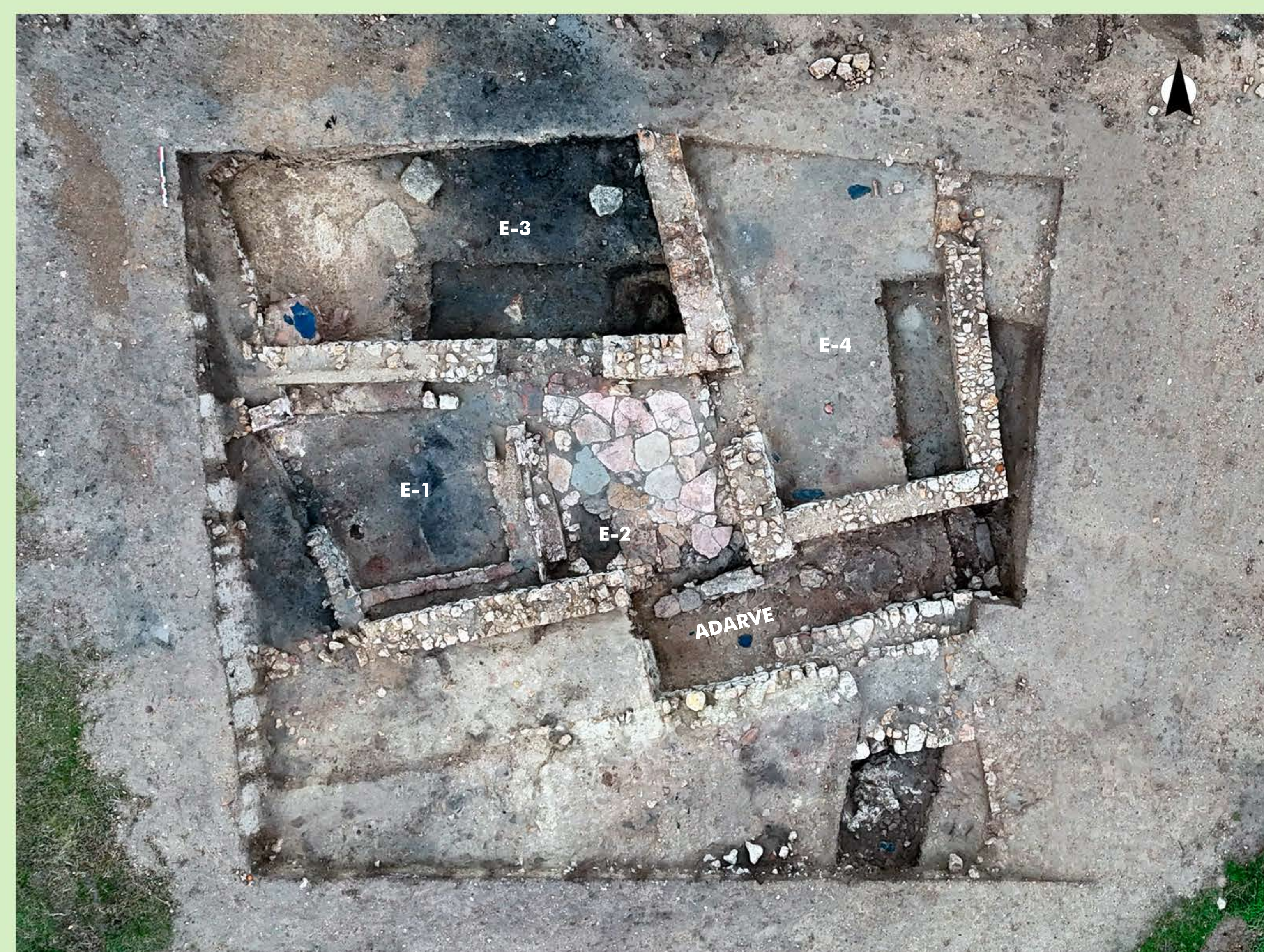
Figura 3. Vista aérea del área de excavación tras los resultados de la campaña de 2024.