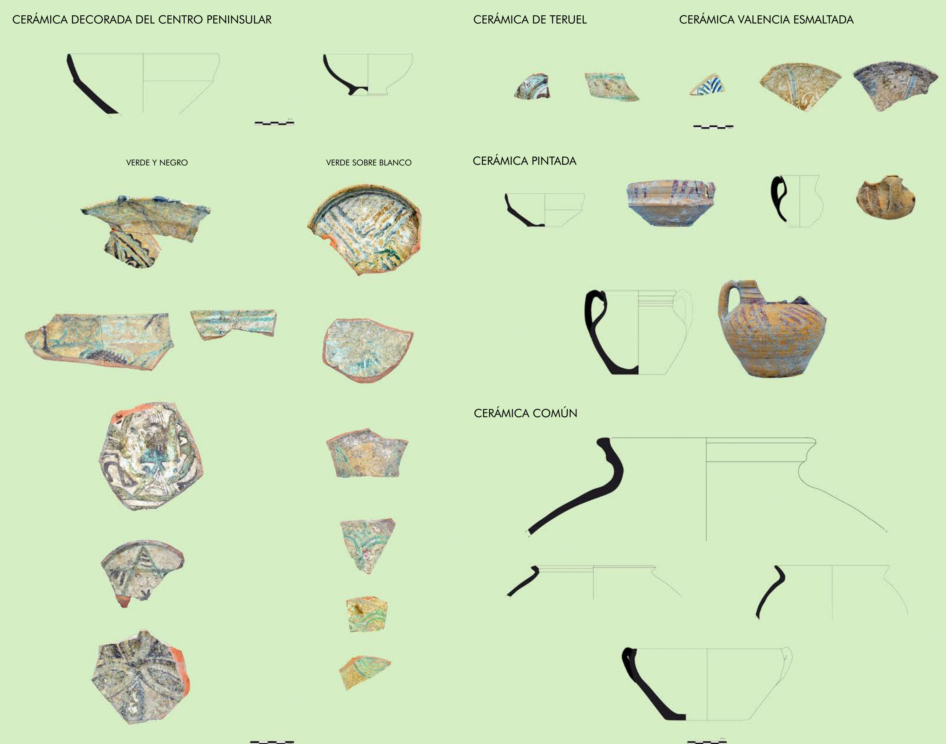
Figura 4. Repertorio cerámico del cerro de la Judería de Atienza (Guadalajara).

Los materiales cerámicos hallados hasta el momento han permitido establecer consideraciones importantes en lo relativo al proceso de ocupación y abandono de estos espacios. El conjunto cerámico registrado ha aportado toda una serie de rasgos morfo-tipológicos y decorativos de gran relevancia para tratar de identificar los principales aspectos de la producción cerámica consumida (Fig. 4). Asimismo, muestra unos primeros indicadores en cuanto a los circuitos comerciales en los que se insertó la villa en los siglos XIII y XIV con respecto a los centros de producción bajomedieval, fundamentalmente en lo que se refiere a los localizados en la cuenca del Duero y el valle del Henares. En este caso, se constata una fuerte presencia de la loza verde y negro mudéjar, y verde sobre blanco del centro peninsular del siglo XIV, con un repertorio formal de cuencos carenados y escudillas hemisféricas de pie anular. Aunque también hay que destacar la presencia de evidencias cuyo origen se asocia a los grandes centros productivos de cerámica esmaltada de la Corona de Aragón durante el periodo bajomedieval (Teruel y Valencia).