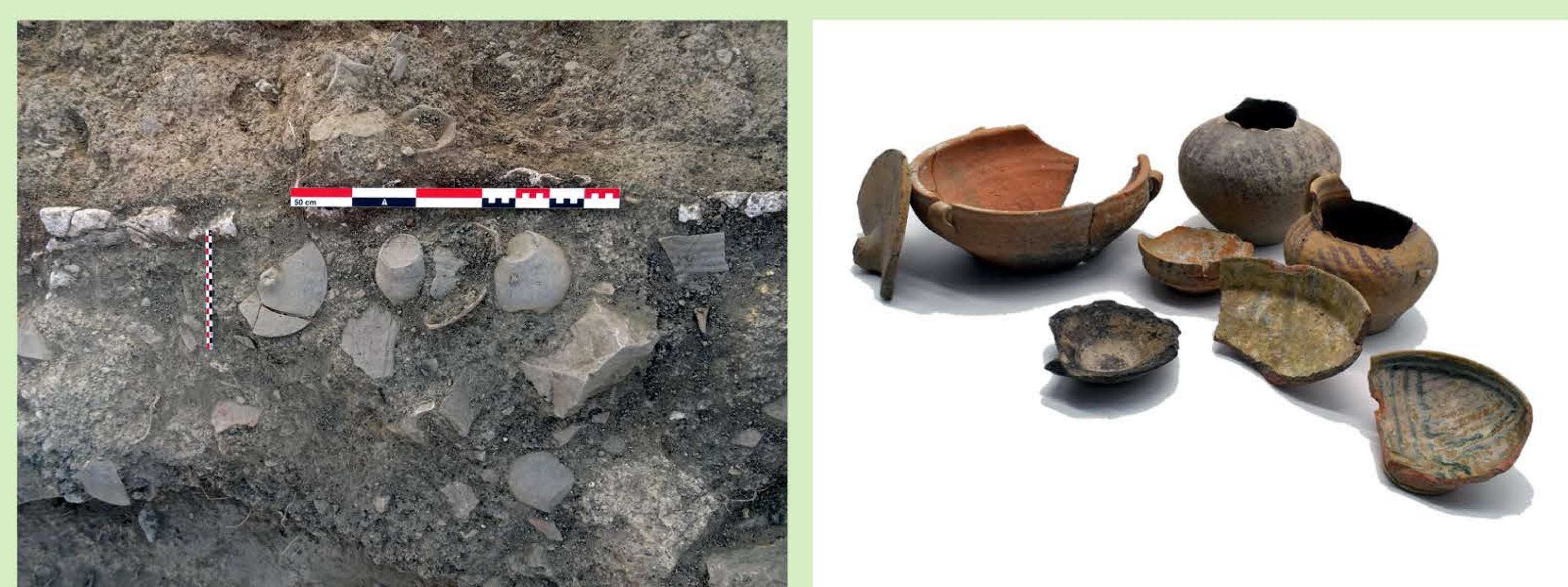
Figura 5. Conjunto cerámico aparecido en el E-1 del complejo arquitectónico del sector 3000 del cerro de la Judería.