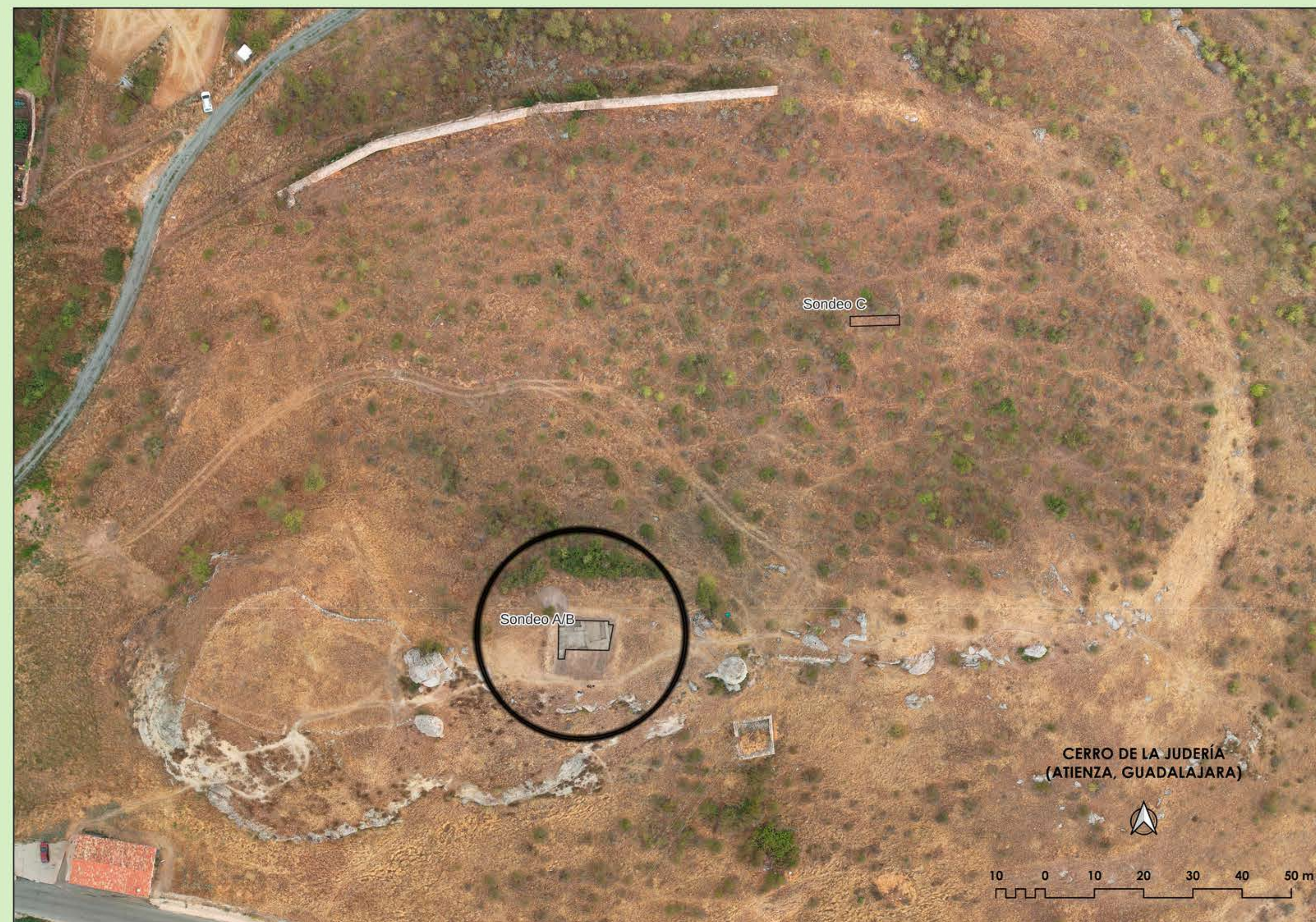
Figura 2. Cerro de la Judería con la localización del área de excavación (círculo negro).