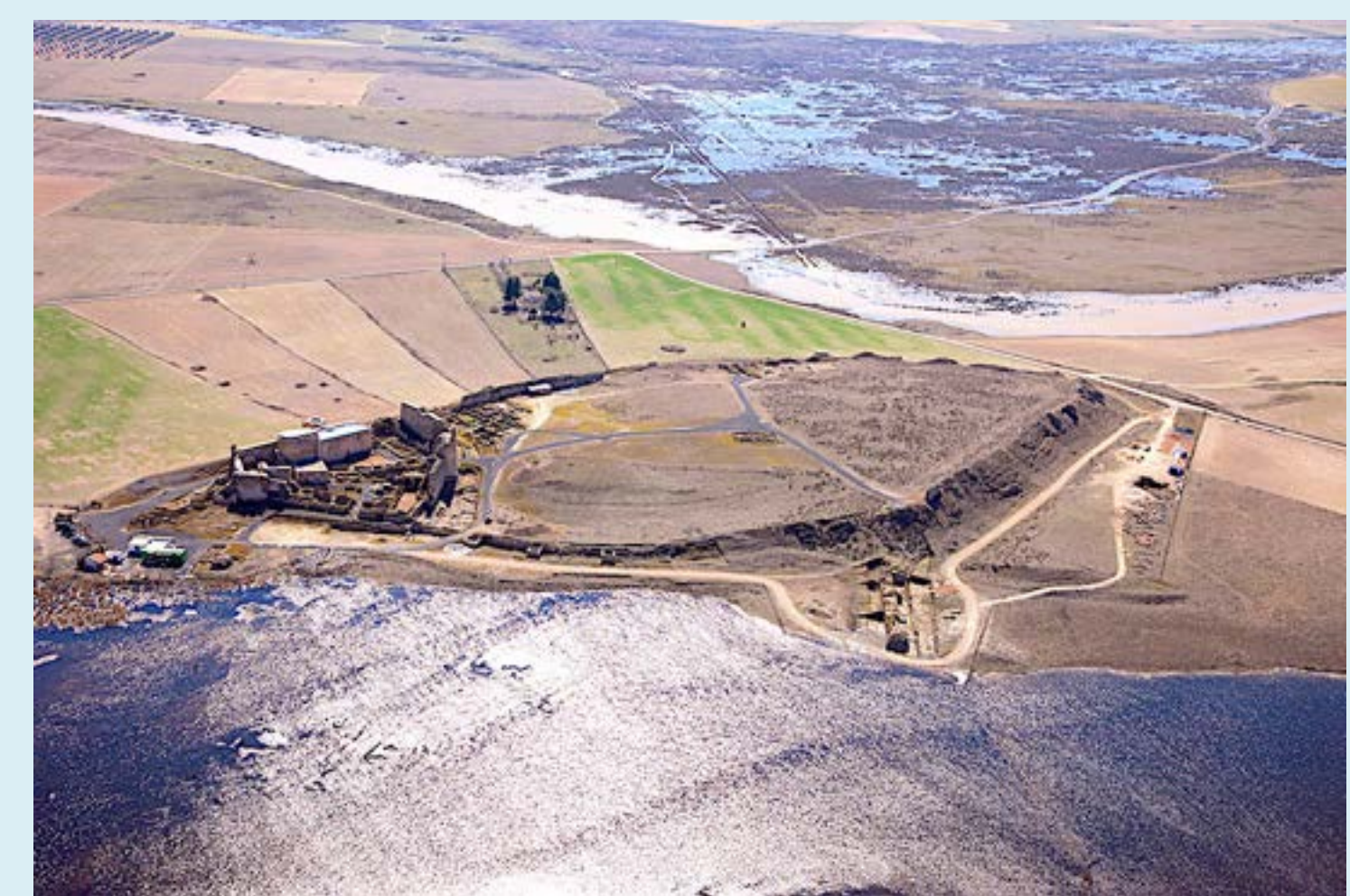
Calatrava la Vieja. Vista aérea desde el norte. En un istmo, entre el río Guadiana y el arroyo Pellejero.