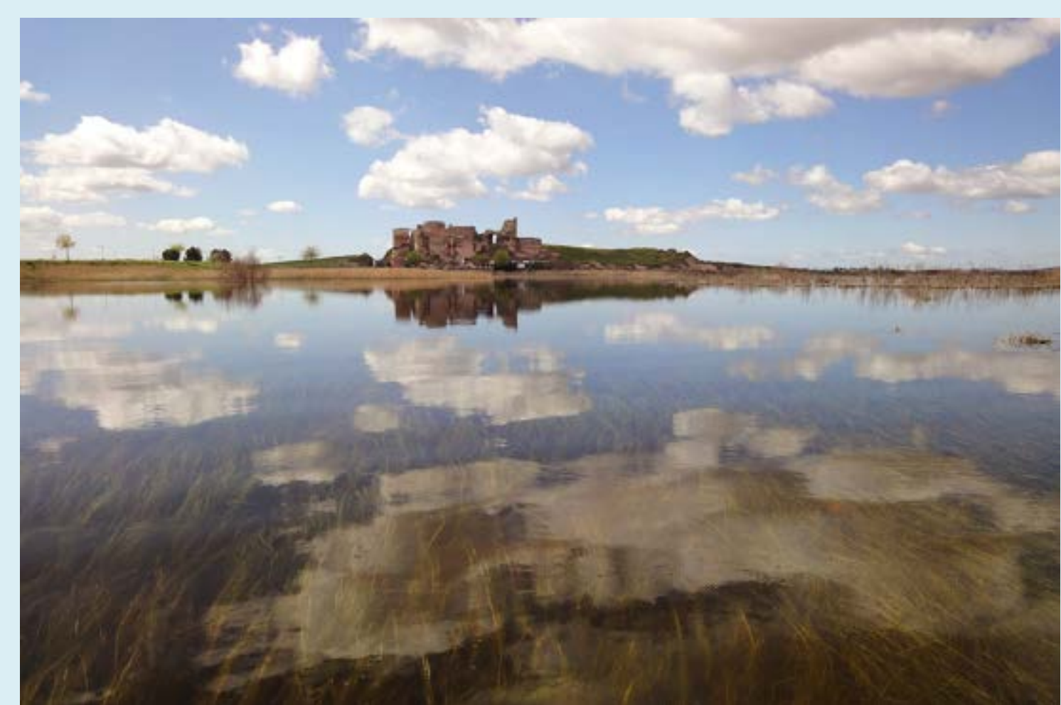
Calatrava la Vieja. Vista desde el norte, con el río Guadiana en primer término.